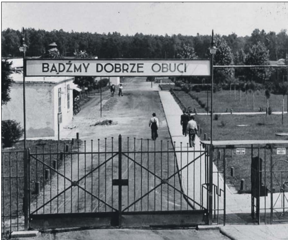
Brama zakładów Bata w Chełmku, lata trzydzieste ubiegłego wieku

Wraz z fabryką powstała kolonia domków wielorodzinnych dla pracowników. Były one wyposażone w bieżącą wodę i kanalizację co na tle okolicznych miejscowości stanowiło wówczas niespotykane zjawisko. Praca na taśmie w fabryce była ciężka i wymagała ogromnej dyscypliny. Bata wymagał, aby życie jego pracowników całkowicie koncentrowało się wokół zakładu, ale jednocześnie rozumiał, że ludzie sprostają tym wymaganiom tylko wtedy, gdy zapewni im poczucie bezpieczeństwa i socjalne zaplecze. Przy fabryce szybko wybudowano przychodnię lekarską i szkołę. Załoga miała do dyspozycji boisko sportowe, tenisowe korty, kregielnię, basen, lodowisko, a nawet skocznię narciarską. Zbudowano zakładową biblio-