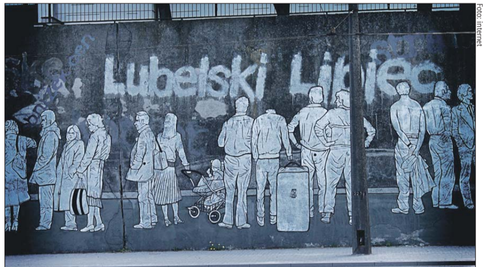
Mural upamięniający Lubelski Lipiec 1980 roku

Tegoroczne obchody rocznicowe trwać będą do 25 lipca.