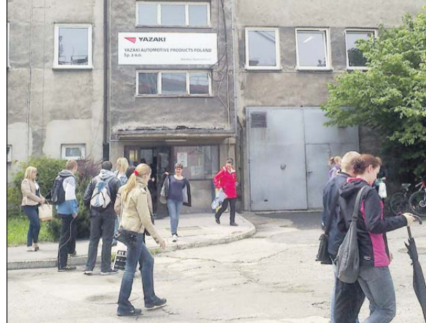
Średnie zarobki w firmie wynoszą 1,9 tys. zł brutto

W czasie rozmów udało się też wynegocjować znaczący wzrost premii świątecznej z 250 do 800 zł netto oraz stopniowe zwiększanie odpisu na zakładowy fundusz świadczeń socjalnych. – Zgodnie z proponowanym porozumieniem już w tym roku dofinansowanie „wczasów pod gruszą”