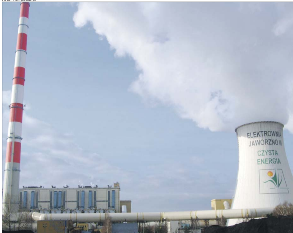
Los backloadingu nie jest przesądzony. Decyzja o jego wdrożeniu musi zostać uzgodniona z Radą Europejską

została przegłosowana w Parlamencie Europejskim. Za przyjęciem backloadingu opowiedziała się m.in. Europejska Partia Ludowa, frakcja, w której zasiadają eurodeputowani Platformy Obywatelskiej i PSL. – Jeżeli to rozwiązanie wejdzie w życie, najprawdopodobniej wzrosną ceny energii, co przełoży się na obniżenie konkurencyjności polskiej gospodarki i powiększenie sfery ubóstwa. Istnieje poważne zagrożenie,