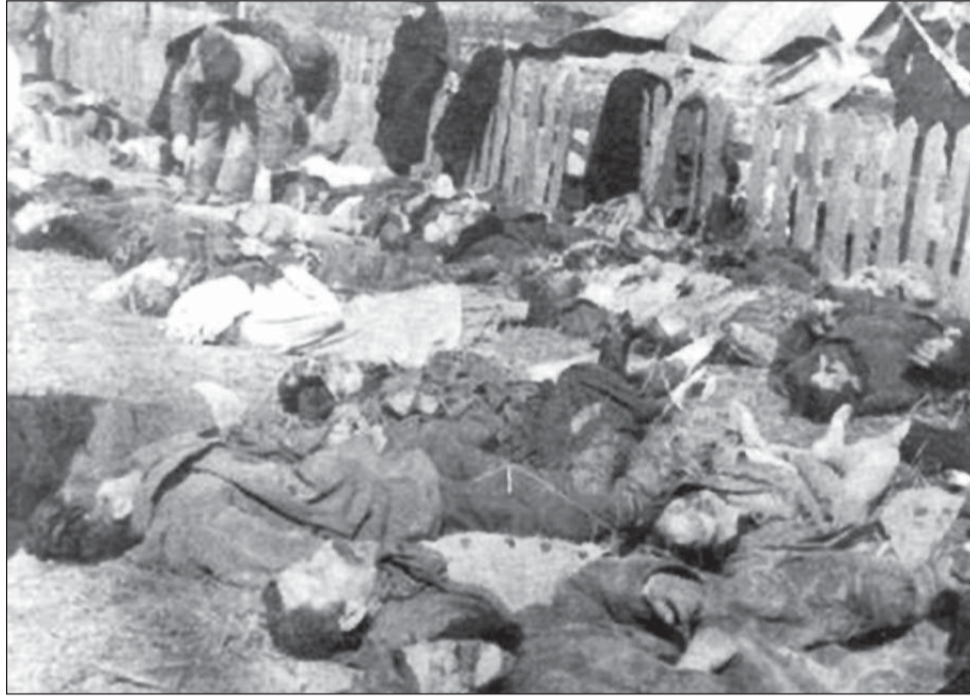
Siekierami odrąbywano ludziom głowy, ręce i nogi, przecinano rącznymi piłami do drzewa, wykuwano oczy

Historycy szacują, że od 1943 do 1944 roku z rąk ukraińskich