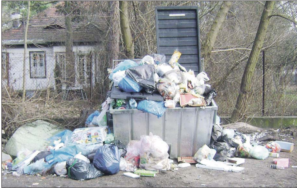
W wielu miejscach wciąż brakuje odpowiednich kontenerów do segregowania odpadów