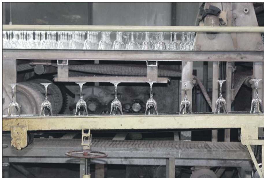
Zawierciańska huta zajmuje się produkcją markowych wyrobów ze szkła

W tragicznej sytuacji znaleźli się pracownicy huty i ich rodziny. Bo jak długo zdołają wegetować za wypłacane raz na jakiś czas przez pracodawcę częściowe wypłaty zaległych wynagrodzeń. To kwoty od 50 do 300 zł. W ubiegłym tygodniu na ich konta wpłynęło po 300 zł. Ale obiecanej drugiej transzy już nie dostali. Zresztą nie po raz pierwszy. – Człowieka szlag trafia, bo czeka na tę jałmużnę, a później okazuje się, że nie dostaje nawet tych paru groszy z częściowych wypłat. Okazuje się, że miesięcznie nie zarobię nawet 800 zł. Cały czas żyję w nerwach. Zastanawiam się, czy nie odejść na zasiłek dla bezrobotnych. Przynajmniej miałbym pewne kilkaset