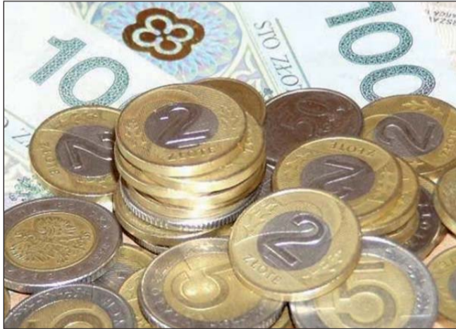
Prawo do akcji Kompanii jest z pewnością warte więcej niż 1000 zł

na akcje Kompanii może pan czekać latami.