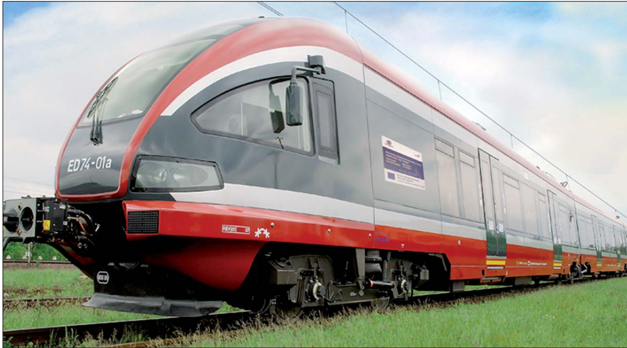
Przewozy pasażerskie to usługa publiczna, która niejako z zasady musi być dotowana, podobnie jak autobusy czy tramwaje

autobusy czy tramwaje. Są połączenia między małymi miejscowościami, które nigdy nie będą same na siebie zarabiały. Skoro rosną koszty m.in. materiałów i energii to automatycznie dotacja też musi być większa. Dotacja, która jest naprawdę bardzo niska. Przewozy Regionalne w całym kraju dostają 800 mln