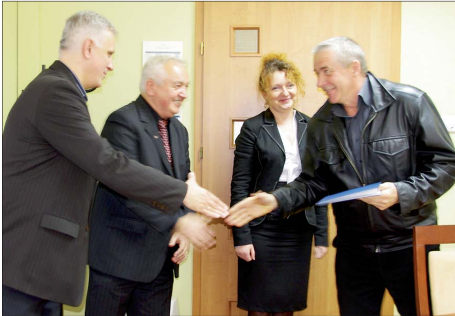
Dyplomy ukończenia „Akademii SIP” odebrało piętnastu społecznych inspektorów pracy

Społeczny inspektor pracy jest cały czas w zakładzie, więc może być bardziej skuteczny niż inspektor PIP, który kontrole przeprowadza od czasu do czasu.