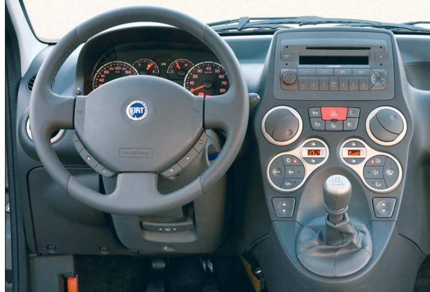
Jeżeli my stanemy, to Fiatowi po prostu zabraknie podzespołów – mówi szef zakładowej „S”

zabraknie podzespołów i wtedy zarówno Denso, jak i Fiat będą miały spory problem – mówi szef zakładowej „S”.