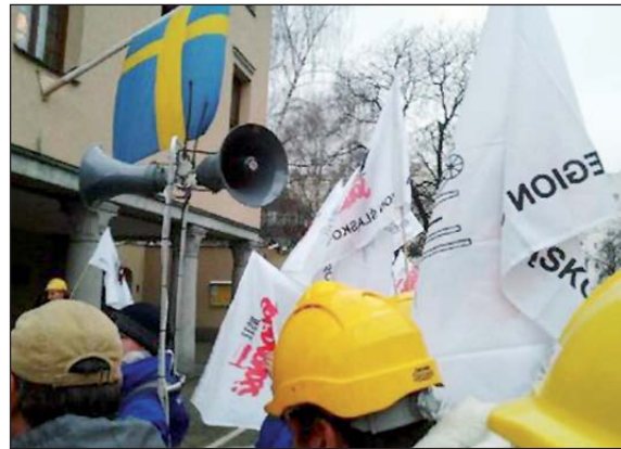
Związkowcy przekazali petycję do Vattenfalla konsulowi Szwecji

strony tego konfliktu – napisali związkowcy w petycji skierowanej do szwedzkiego ambasadora. Pismo w czasie pikietu odebrał od nich szwedzki konsul.