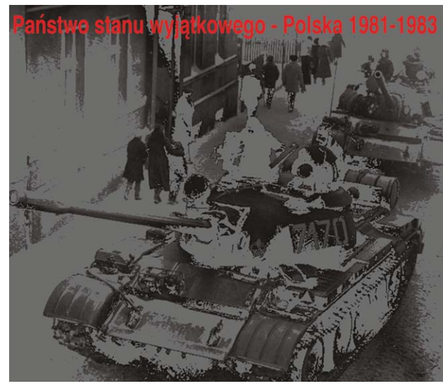
Państwo stanu wyjątkowego - Polska 1981-1983

Tekst pochodzi z serwisu pravo-pracy.pl.