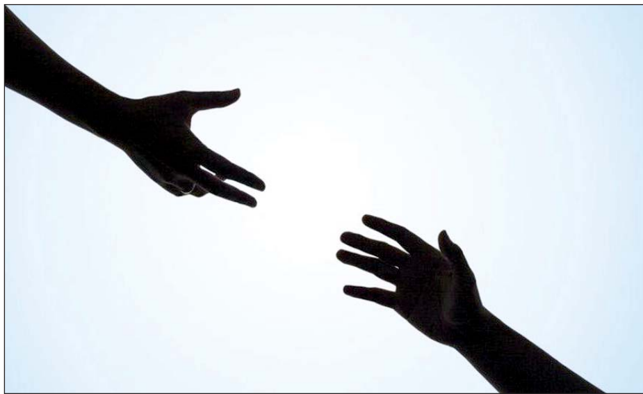
Solidarność jest związkiem otwartym na ludzi, który może zrobić wiele dobrego

Później związkowcy z sądownictwa dowiedzieli się, że w Mysłowicach znajduje się placówka, do której trafiają najmniejsze dzieci, niejednokrotnie prosto ze szpitala. – Ta