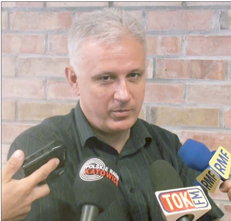
Chodzi o to, aby nie głosować pod dyktando partyjnych układaczy list, ale poszukać ludzi mądrych, fachowców na mniej eksponowanych miejscach – zachęca szef Śląsko-Dąbrowskiej Solidarności