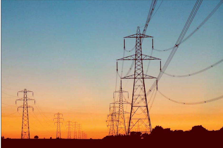
Wdrożenie zapisów pakietu od 2013 roku doprowadzi do dużego wzrostu cen energii i ciepła w Polsce

mina premierowi, że podczas czerwcowego spotkania był autentycznie zainteresowany zagadnieniem pakietu klima-