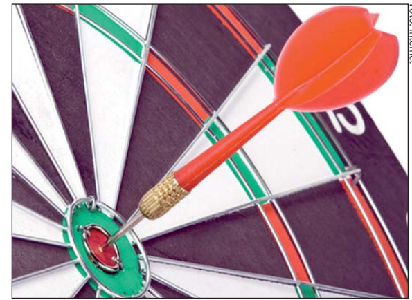
Dart to profesjonalny sport, jak również tradycyjna rozrywka w pubach