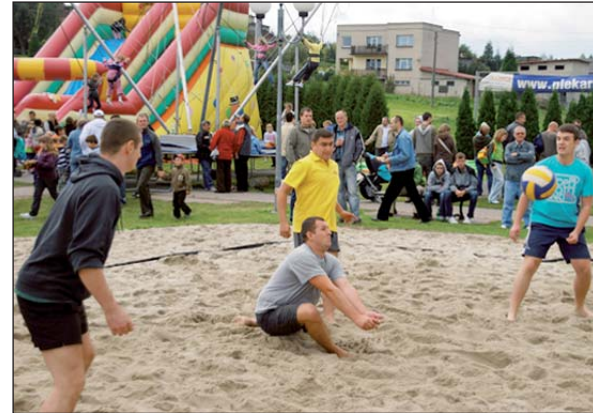
Jedną z atrakcji festynu była siatkówka plażowa