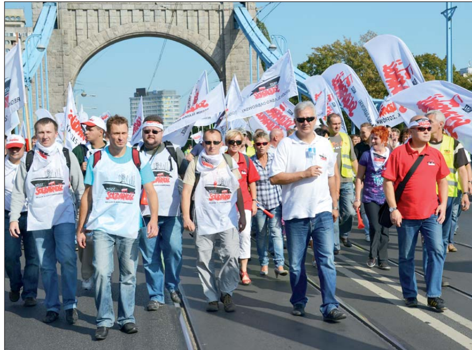
Jedną z najliczniejszych i najbardziej barwnych grup stanowili członkowie Śląsko-Dąbrowskiej Solidarności

we Wrocławiu nauczyła się swojego wystąpienia po polsku. Podkreślała, że Europa potrzebuje związków zawodowych i dialogu społecznego, a nie ataków na prawa pracownicze i socjalne.