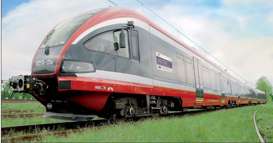
Związkowcy apelują do marszałka województwa śląskiego o wstrzymanie uruchomienia Kolei Śląskich do czasu zakończenia prac obu zespołów

Nie ma pewności, czym ten szczyt się zakończy – rozmowami, czy konkretnymi zmianami.