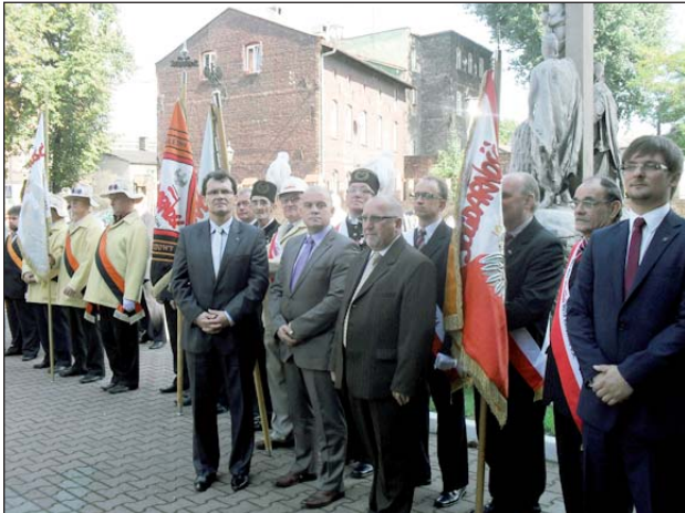
W uroczystościach z okazji 31. rocznicy powstania Solidarności w Hucie Baildon uczestniczyli członkowie prezydium Zarządu Regionu

nymi medalami Regionu Śląsko-Dąbrowskiego NSZZ Solidarność.