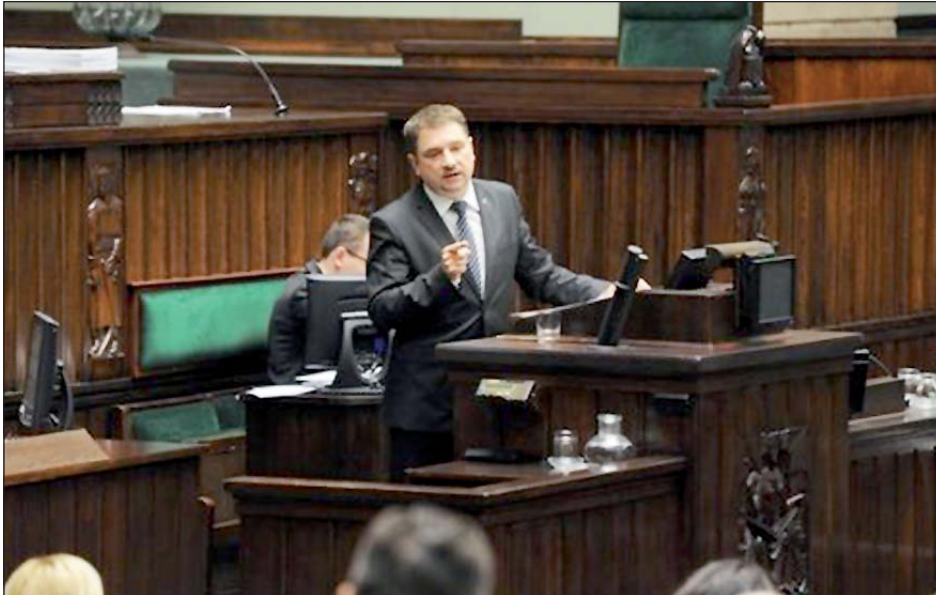
Mają Państwo okazję, by spełnić obietnice wyborcze – mówił w Sejmie szef Solidarności

wynagrodzenia, czyli poziom będący standardem w UE. – Doszło nawet do złamania zaakceptowanych przez rząd ustaleń. Bo jak inaczej ocenić sytuację, z