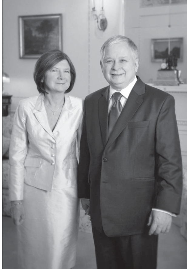
Lech Kaczyński i jego małżonka byli ludźmi wrażliwymi na problemy społeczne – wspomina Bożena Borys-Szopa

Prywatnie zapamięta Lecha Kaczyńskiego, jako osobę niezwykle oczytaną, posiadającą ogromną wiedzę na rozległe tematy i prawdzi-