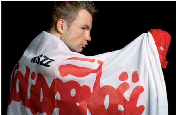
Skuteczny, silny, prawy postać rywala na deski w trzeciej rundzie

Jonak zaczął dość asekuracyjnie, ale w trzeciej rundzie przyspieszył i prawym sierpowym powalił rywala na deski. Estończyk był liczony, ale potwierdził renomę twardego pięściarza. Umie-