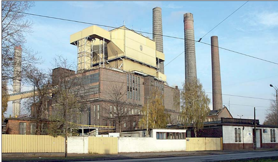
W pakietach zapisano, że wszelkie cięcia zatrudnienia będą konsultowane ze stroną społeczną