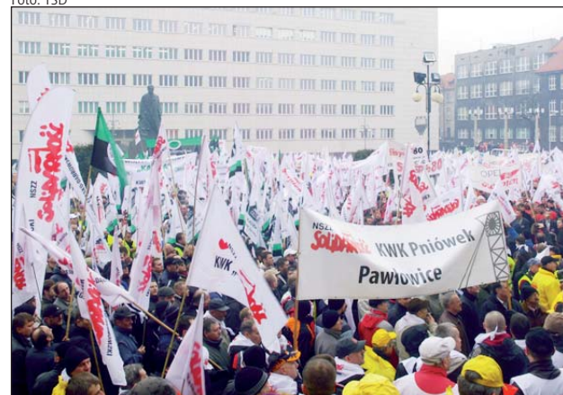
Związkowcy z KW i PKW zapowiadają podjęcie dalszych działań wynikających z ustawy o rozwiązywaniu sporów zbiorowych

Zarząd spółki proponuje podwyżki w wysokości 2-3 proc., co zdaniem Sopa-