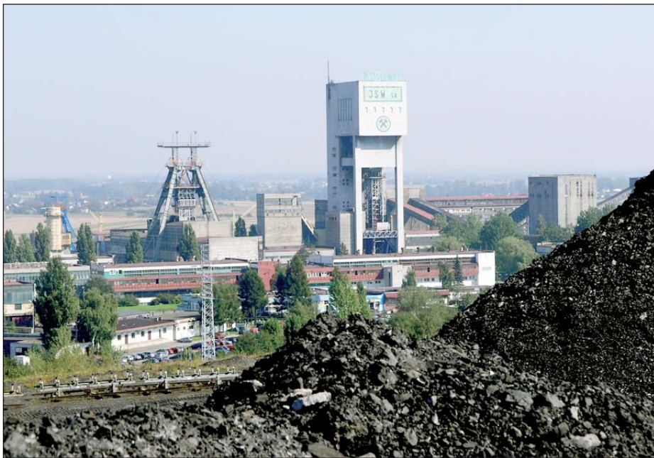
Mimo braku zgody związków wyznaczono już termin debiutu giełdowego JSW S.A.

W poniedziałek w Katowicach odbyło się posiedzenie zespołu roboczego ws. prywatyzacji spółek węglowych powołanego w ramach Zespołu Trójstronnego ds. Bezpieczeństwa Socjalnego Górników. Na obradach nie pojawił się zaproszony przez związkow-