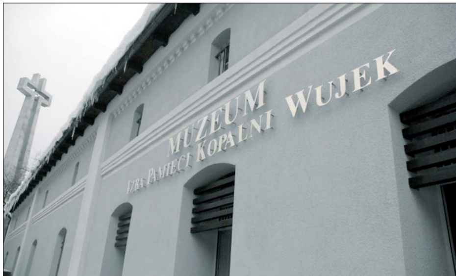
Śląskie Centrum Solidarności powstanie w miejscu, gdzie stoi budynek dawnego magazynu kopalni Wujek

Centrum ma być instytucją o charakterze muzealno-edukacyjnym. – Chcemy, aby