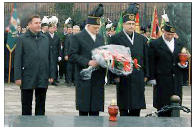
Pielgrzymi złożyli kwiaty przed pomnikiem Prymasa Tysiąclecia