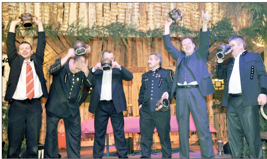
POD Uczestnicy zawodów w picciu piwa zaprezentowali formę reprezentacyjną