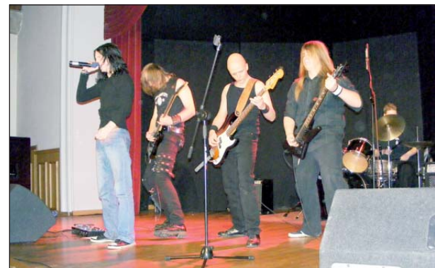
Muzycy z Shadow Way jeden z utworów zadedykowali Solidarności z kopalni Staszic