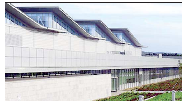
Valeo to firma z tradycjami, w której nie powinno być przyzwolenia na nieodpowiednie traktowanie pracowników