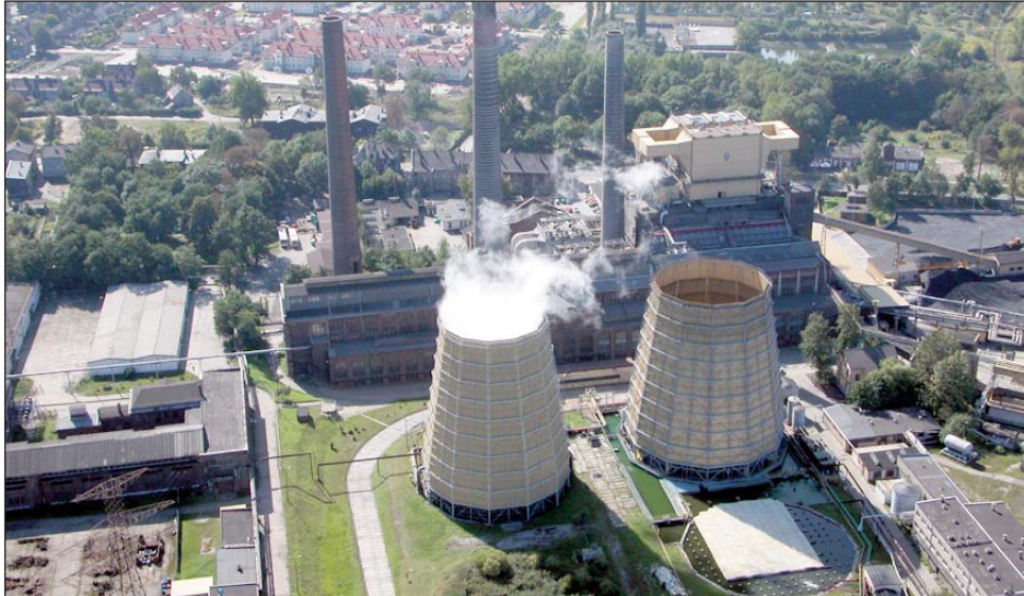
Organizacje związkowe z EC Zabrze nie chcą, aby prywatyzacja oznaczała wyłącznie zwolnienia i cięcia

Związkowcy nie są przeciwni prywatyzacji, ale chcą być traktowani po partnersku.