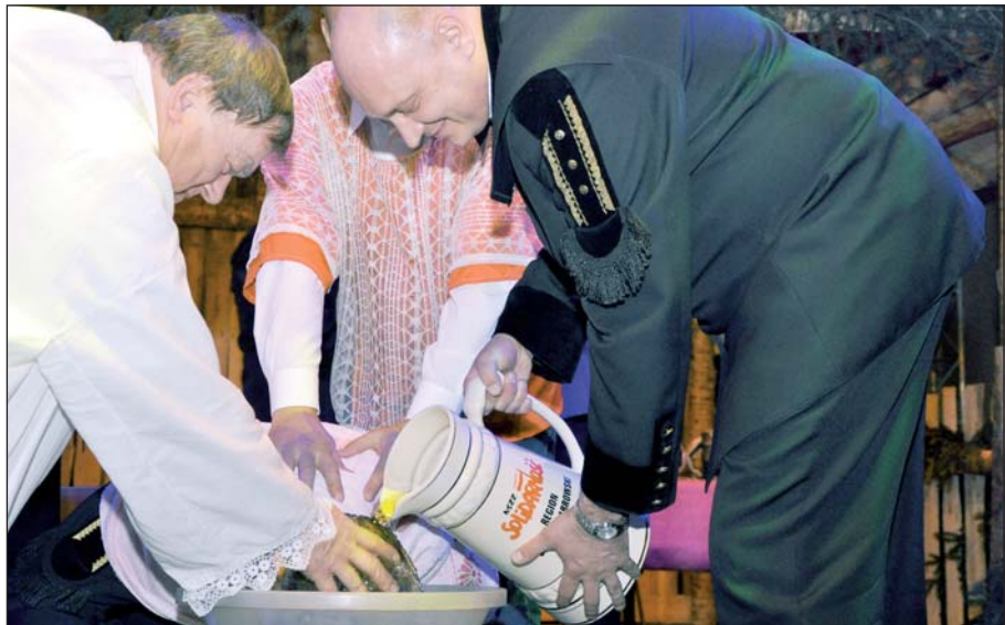
Chrzest piwem to jeden z nieodłącznych elementów każdej Karczmy