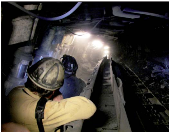
Bez inwestycji początkowych kopalnie czekają kłopoty