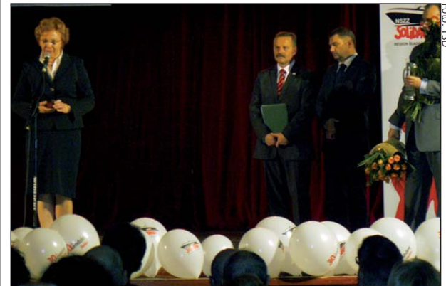
Prezydent Małgorzata Mańka-Szulik dziękuje zabrzańskim związkowcom za owocną współpracę