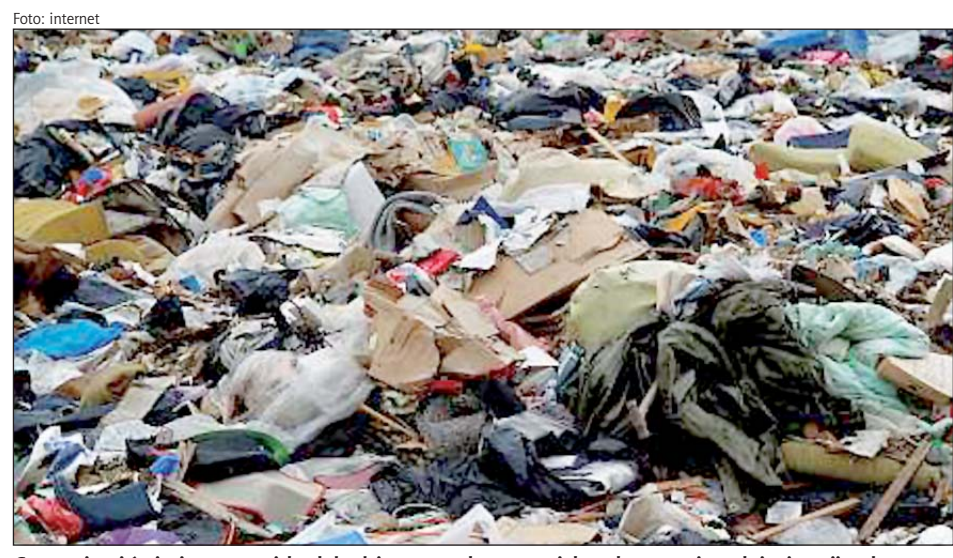
Coraz więcej śmieci na wysypiskach będzie oznaczało coraz większe kary za niespełnienie unijnych norm

umowę, w której ustalono, że do końca marca 2010 r. GZM złoży wniosek o dofinansowanie budowy spalarni. Dokument został przygotowany, ale – jak informuje WFOŚiGW – był niekompletny, zabrakło w nim decyzji środowiskowej, którą powinien wydać prezydent Knurowa. – W trakcie oceny wniosku stwierdzono brak dokumentacji związanej z przeprowadzonym postępowaniem dotyczącym oceny oddziaływania na środowisko oraz sformułowano szereg uwag, o czym poinformowano wnioskodawcę – relacjonuje Piotr Biernat, rzecznik prasowy WFOŚiGW w Katowicach. – W tej sytuacji Fundusz skierował do Ministerstwa Środowiska prośbę