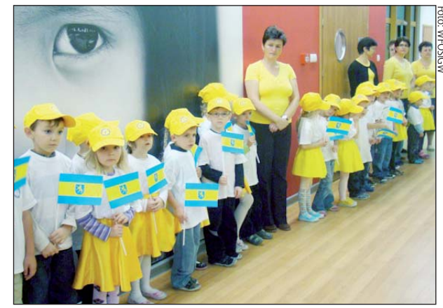
Z ekologicznego przedszkola będzie mogło korzystać 200 dzieci

Inwestycja zrealizowana została przy pomocy finansowej Wojewódzkiego Funduszu Ochrony Środowiska i Gospodarki Wodnej w Katowicach. Dotacja i pożyczka preferencyjna na ten cel przyznana przez katowicki Fundusz wyniosła 750 tys. zł. Środki przeznaczone zostały na zamontowanie ekologicznego ogrzewania z wykorzystaniem pompy ciepła oraz zabudowę 24 instalacji solarnych wspomagających przygotowanie ciepłej wody. Budynek w pełni został dostosowany do potrzeb i wygody dzieci. Znajdują się w nim przestronne i bezpieczne pomieszczenia z kilkoma salami dydaktycznymi, nowoczesnie urządzoną salą do rytmiki i pracownią informatyczną. Dzieci mogą korzystać również z ogrodu i placu zabaw.