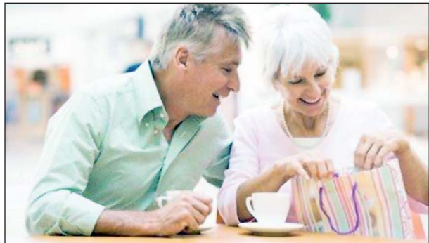
Zdaniem Solidarności zróżnicowanie wieku emerytalnego mężczyzn i kobiet powinno zostać utrzymane

Zdaniem Trybunału, zarzuty RPO nie dotyczyły w istocie samego zróżnicowania wieku ale z konsekwencji tego zróżnicowania – niższego przeciętnego poziomu świadczeń emerytalnych kobiet. Trybunał Konstytucyjny zwrócił uwagę, że różnica wyso-