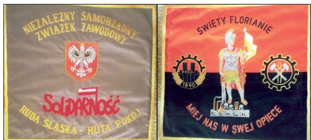
Awers i rewers sztandaru Solidarności Huty Pokój