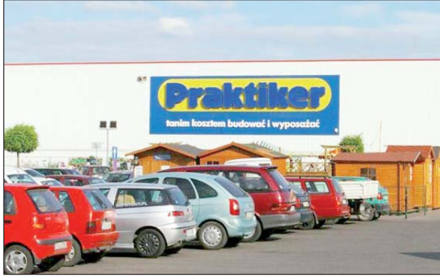
Niskie zarobki i braki w zatrudnieniu – to główne problemy w sieci Praktiker

cy. - Na początku działalności Praktikera w Polsce przyjętych zostało więcej osób, ale te, które gorzej pracowały zostały zwolnione – dodaje Włodarczyk.