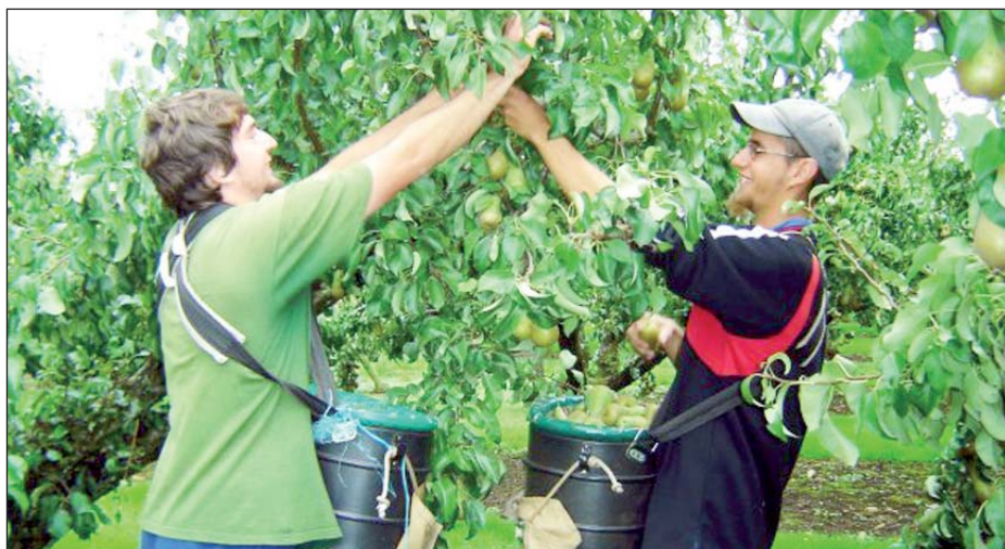
Najczęstszym problemem dla młodych pracowników jest zatrudnianie ich „na próbę” i niezawieranie pisemnych umów o pracę