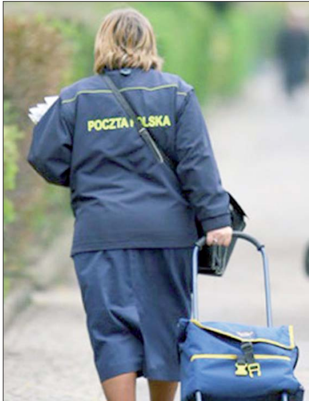
- Działania zarządu są sprzeczne z cywilizowanymi relacjami na linii pracodawca-pracownik – uważają związkowcy z Poczty Polskiej

Związkowcy twierdzą, że straty są spowodowane potężnymi błędami w zarządzaniu. Władze zamiast zajmować się rozwojem firmy i