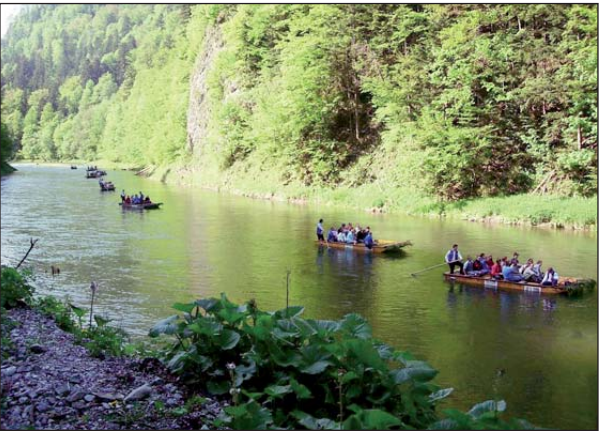
Ukochana przez Polaków majówka potrwa w tym roku zaledwie 3 dni

Miesiąc później również możemy odpocząć od pracy przez 4 dni. Wystarczy, że po Bożym Ciele (w tym roku przypada 3 czerwca) weźmiemy wolny piątek. Na przedłużony weekend nie możemy niestety liczyć w sierpniu. Święto Wniebowzięcia Najświętszej Marii Panny obchodzimy w tym roku w niedzielę.