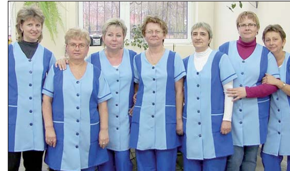
– Dzięki pomysłowi Solidarności 7 pracownic zwolnionych z zakładu znów może pracować