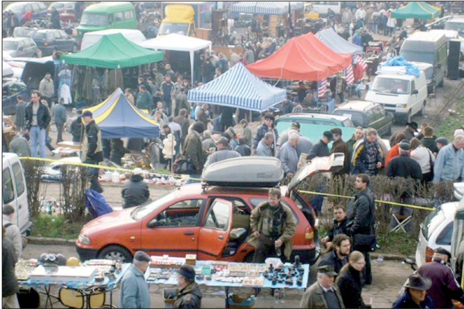
Rozkwit prywatnego handlu - jeden z efektów planu Balcerowicza

roku uchwalone zostały kolejne ustawy prowadzące do zmian w prawie podatkowym i bankowym.