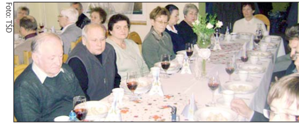
Solidarność z Bombardiera pamięta o swoich emerytach

Solidarność katowickiej firmy Bombardier nie zapomina o związkowych emerytach i rencistach. Dla kilkudziesięciu z nich tradycyjnie zorganizowała opłatkowe spotkanie.