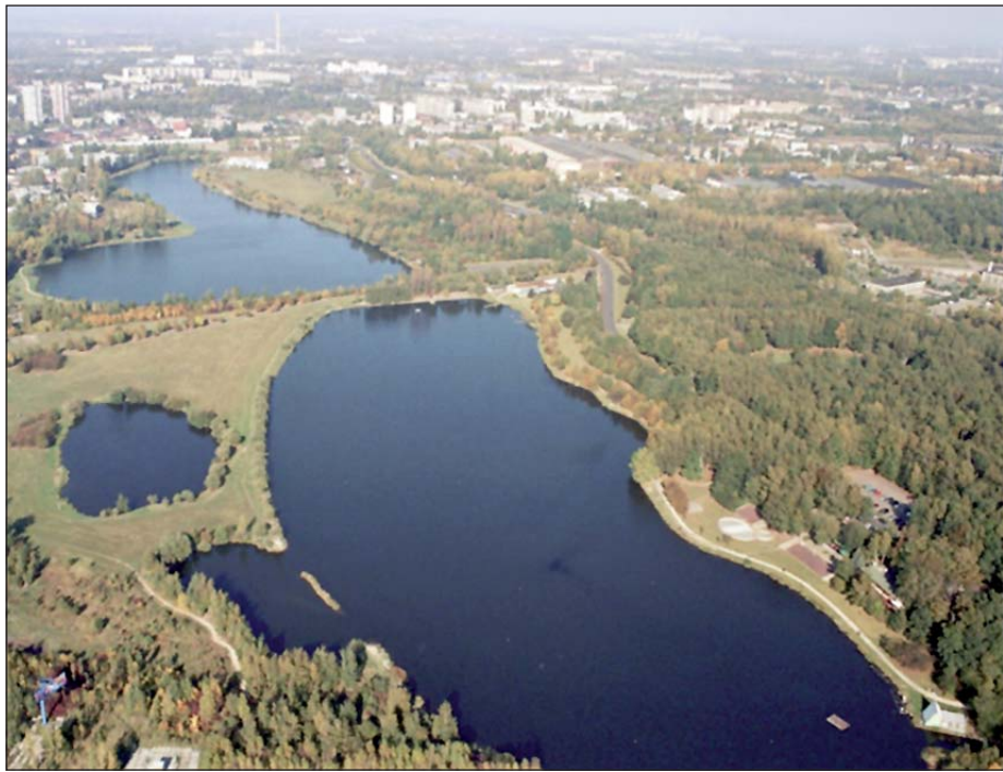
Dolina Trzech Stawów w Katowicach powstała w wyniku podziemnego górnictwa i powierzchniowego wydobycia piasku i żwiru