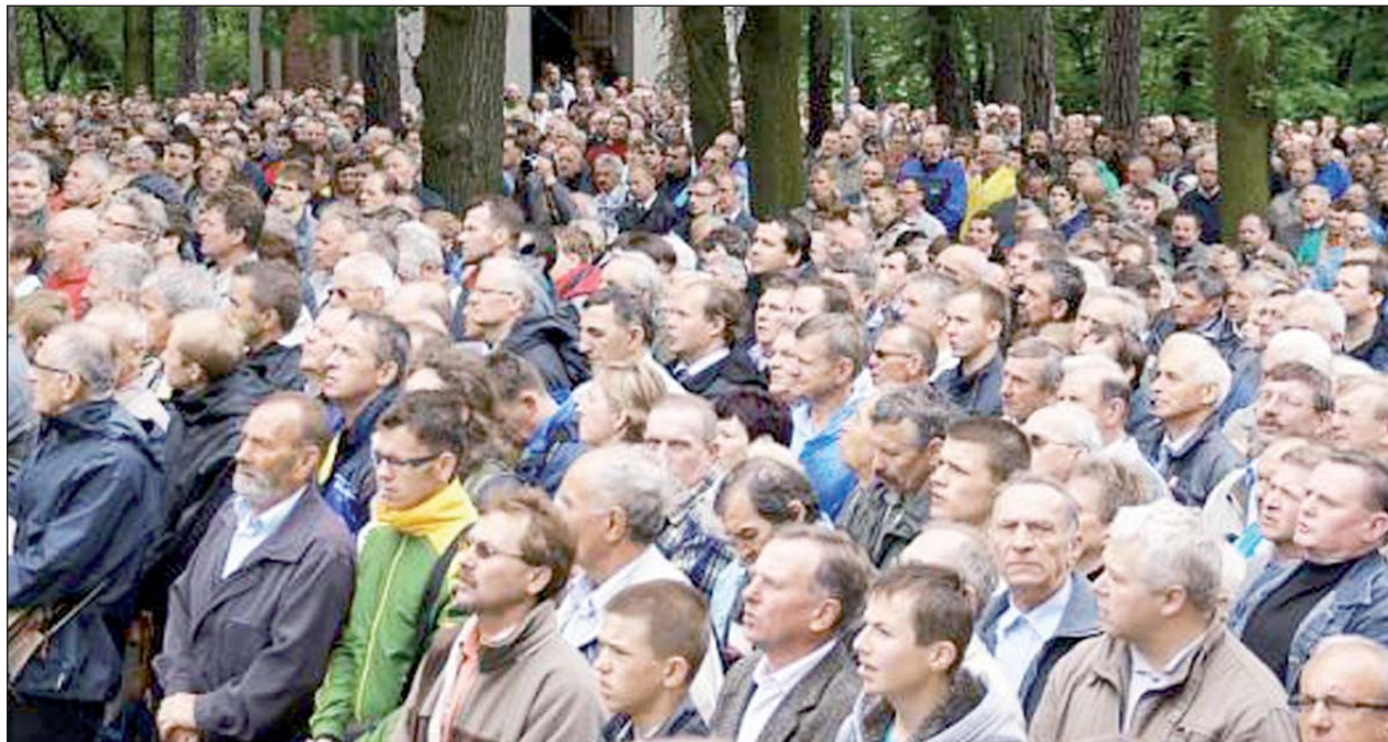
Piekarska Pielgrzymka Mężczyzn i Młodzieńców jest jednym z najważniejszych wydarzeń religijnych na Górnym Śląsku

jest panem życia od jego początku, aż do naturalnej śmierci”. Przypomniał słowa Jana Pawła II „Nie zabijaj, ale raczej przyjmij drugiego człowieka, jako