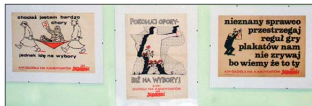
W siedzibie Śląsko-Dąbrowskiej „S” można obejrzeć plakaty wyborcze z 1989 r.

W siedzibie Zarządu Regionu w Katowicach można obejrzeć plakaty wyborcze z 1989 r. Mini wystawa nawiązująca do pierwszych częściowo wolnych wyborów parlamentarnych znajduje się na parterze przy wejściu do budynku.