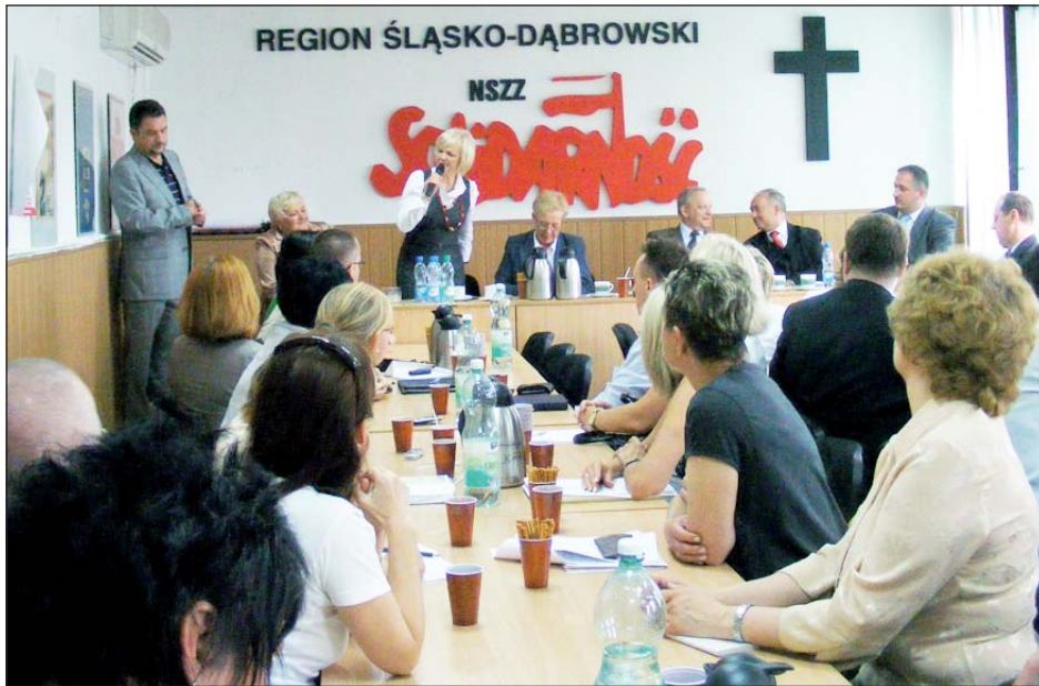
Spotkanie zdominowała dyskusja o zagrożeniach związanych z przekształcaniem szpitali w spółki prawa handlowego

Do przekształcenia szpitali w spółki prawa handlowego będą dążyły te samorządy, które mają problemy z utrzymaniem płynności finansowej swoich placówek.