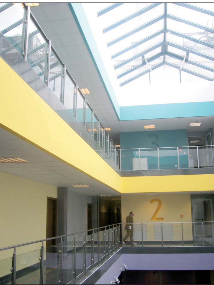
Jedną z energooszczędnych tajemnic tkwi w stropach, które zimą ogrzewają budynek a w lecie go chłodzą

Zużywa tylko 1/3 energii. Nie posiada C.O i klimatyzacji. Ogrzewanie i chłodzenie zapewnia system rur BKT oraz pompa ciepła. System pracuje w dni robocze, w weekendy przechodzi w stan uśpienia