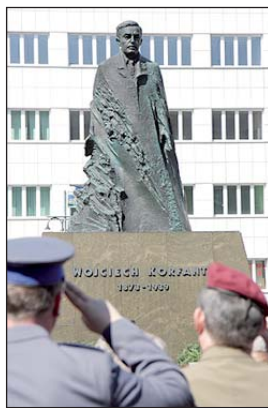
Uroczystości pod pomnikiem

W Katowicach rozpoczęły się obchody Roku Wojciecha Korfanta.