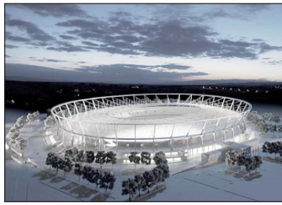
Tak będzie wyglądał przebudowany Stadion Śląski

Nie mam złudzeń, które są cichą nadzieją niektórych: wspólna organizacja piłkarskich mistrzostw Europy będzie równomiernie rozłożona między cztery miasta w Polsce i cztery na Ukrainie. To podział nie dość, że najbardziej prawdopodobny, to jeszcze najbardziej sprawiedliwy – „napalenie się” na tzw. rozwiązanie asymetryczne (6 miast w Polsce i 2 na Ukrainie ewentualnie 5 do 3) jest moim zdaniem, nierozsądne i do tego niehonorowe, choć przecież zwiększyłoby szanse Chorzowa i aglomeracji górnośląskiej. Ale skoro wspólnie się zgłosiliśmy, wspólnie organizujemy na równych prawach.