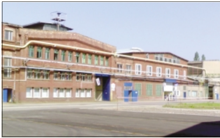
„Solidarność” oflagowała hale Alstomu

zarządu informacji na temat sytuacji płacowej w zakładzie, co jest jednoznaczne z łamaniem ustawy o związkach zawodowych oraz z naruszeniem Zakładowego Układu Zbiorowego Pracy. Ten dokument zawiera zapis, że zarząd powinien informować związki o płacach w poszczególnych grupach pracowników. W trakcie trwania sporu związkowcy pisemnie poinformowali członków zarządu o rozszerzeniu go o punkt dotyczący nieprzezwyciężania przez pracodawcę