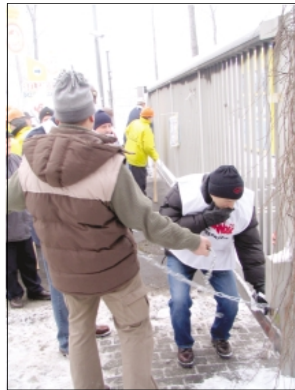
Dyrekcja sklepu zamknęła bramy sklepu, które później zostały spięte łańcuchami

Związkowcy z "Solidarności" z innych regionów protestowali pod siedzibą centrali Selgrosa w Poznaniu. - Spotkaliśmy się tu dziś, by pokazać, że realizujemy zasadę "jeden za wszystkich, wszyscy za jednego" - mówił przewodniczący związku Janusz Śniadek .