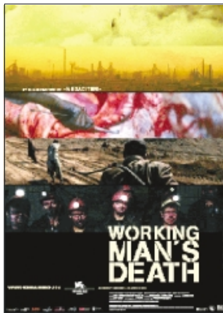
To jeden z najlepszych obrazów dokumentalnych w ostatnich latach

ników oraz znaczenie etosu pracy we współczesnym świecie odpowiedzieć spróbują związkow-