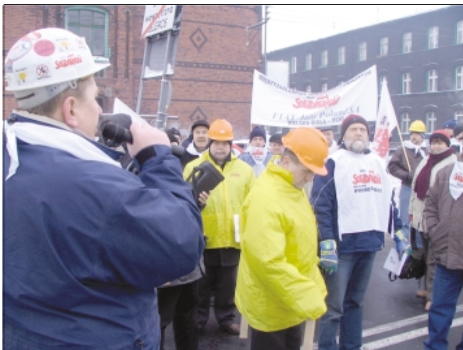
W manifestacji w Katowicach uczestniczyli również związkowcy z Podbeskidzia