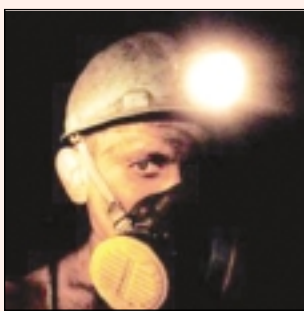
Górnik z Ukrainy

dyskotekę; dziś Zachód konsumuje, podczas gdy inni harują na jego dobrobyt.